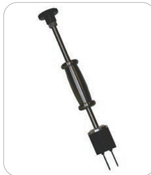
BLD5055 Sonda a martello Heavy Duty