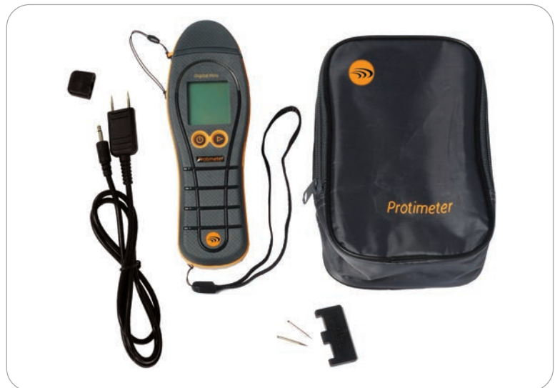
BLD5702 - Kit standard Digital Mini