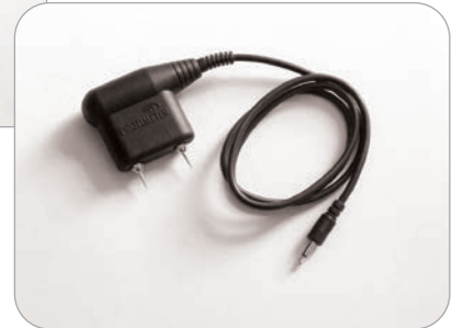
BLD5060 Sonda a 2 aghi Heavy Duty